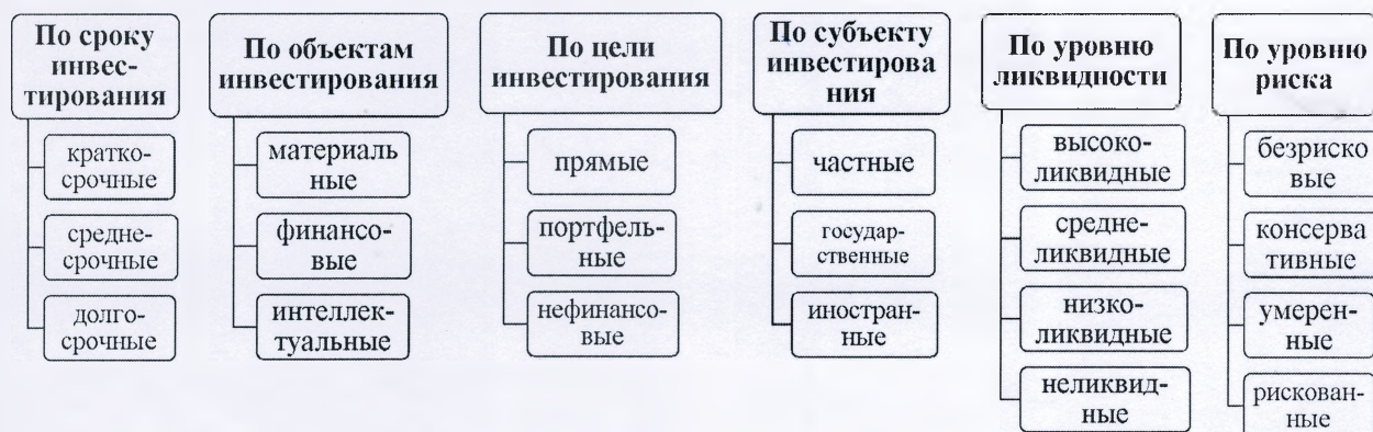
Рисунок 1.2. Классификация инвестиционных активов