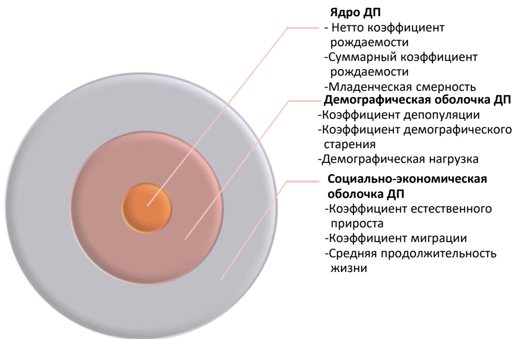
Рисунок 2.1. Структура демографического потенциала

Следующие три показателя являются своеобразной демографической оболочкой ДП. Это коэффициент депопуляции населения, коэффициент демографического старения и уровень демографической нагрузки нетрудоспособного населения на трудоспособное.