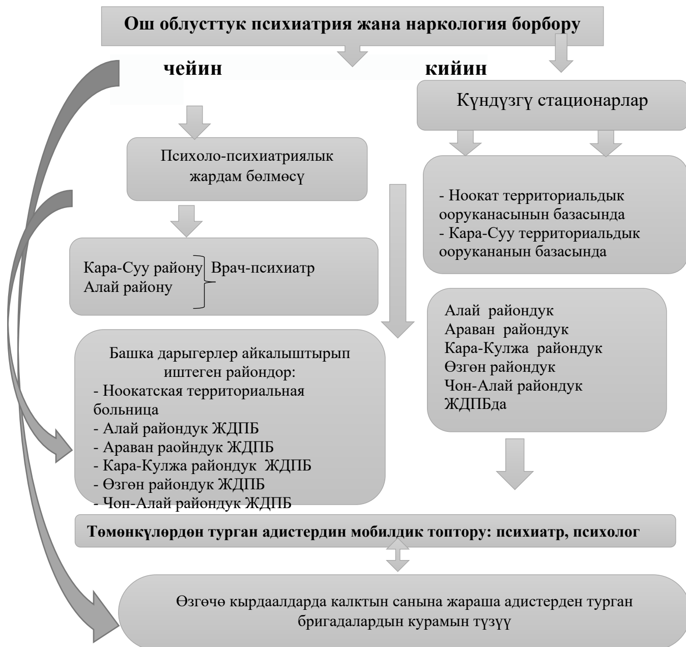
5.1-сүрөт – Ош облусунун калкына психиатриялык жардам көрсөтүүнү уюштуруу модели.

Өзүнө жардам жана өз ара жардам көрсөтүү тобу - абалы күнү-түнү байкоо жүргүзүүнү жана дарылоону талап кылбаган психикалык жана жүрүм-туруму бузулган бейтаптарга медициналык жардам көрсөтүүгө арналган стационардан тышкаркы жана стационардык психиатриялык бөлүмдөрдүн ортосундагы аралык звено; Диагностикалык жана дарылоо жардамына муктаж болгондор күндүз стационардыкка жакын көлөмдө жана интенсивдүүлүктө.