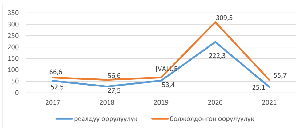
3.4.2-сүрөт – Ош облусунда психикалык бузулуулардын жана жүрүм-турумдун бузулушунун реалдуу жана болжолдонгон ооруларынын регрессиялык сызыгы.

Ош шаарында оорунун болжолдонгон тенденциясы 2020-жылы иш жүзүндөгү оорунун жогорку деңгээлинин фонунда эң жогорку болгон (3.4.2-сүрөт).