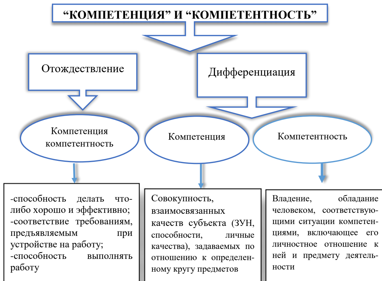
Схема 2. Соотношение понятий "компетенция» и «компетентность"

Таким образом, полученный анализ показывает многомерность и неоднозначность трактовки понятий "компетенция" и "компетентность", и выявляет, два варианта толкования соотношения этих понятий: они либо отождествляются, либо дифференцируются. (Схема 2.) Учитывая наличие разных определений понятий "компетенция" и "компетентность" мы отмечаем, что понятия терминов компетенция и компетентность тесно связаны между собой.