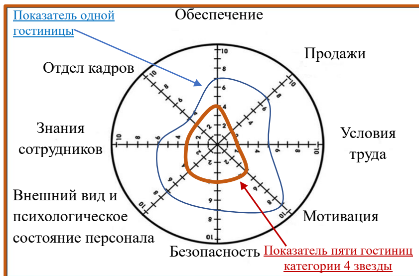
Рисунок 3.2. Колесо баланса отдела Фронт офис в гостиницах 4 звезды Бишкека

Для анализа работы отдела Хаускипинг был проведен опрос в пяти 3х звездочных гостиницах, расположенных в Бишкеке. В этом опросе были получены ответы на 80 вопросов по таким темам, как “профессиональная химия”, “оборудование и инвентарь”, “стандарты уборки”, “особенности персонала и командная работа”, “мотивация”, “условия труда”, “безопасность”. Также для определения кризисной готовности гостиничного бизнеса Бишкека в октябре – ноябре 2023 года проведен опрос в двадцати двух 3, 4 и 5-звездочных отелях города. Анализ показывает, что колесо работы отдела Хаускипинг и Антикризисного управление гостиниц далеки от идеала как и на рисунке что показан выше. Стоит отметить что руководители гостиниц участвовавшие в опросе отмечали легкость и удобство методики для проведения внутреннего аудита персоналом, который не имеет специального образования по направлению туризм и гостиничная деятельность.