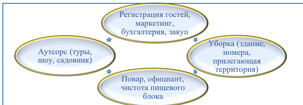
Рисунок 3.4. Организация управления гостиничного комплекса “Байтик” по системе холократия

Планирование персонала гостиничного комплекса “Байтик” осуществляется по системе “холократия, при этом персонал набирается всего на три позиции (рисунок 3.4).