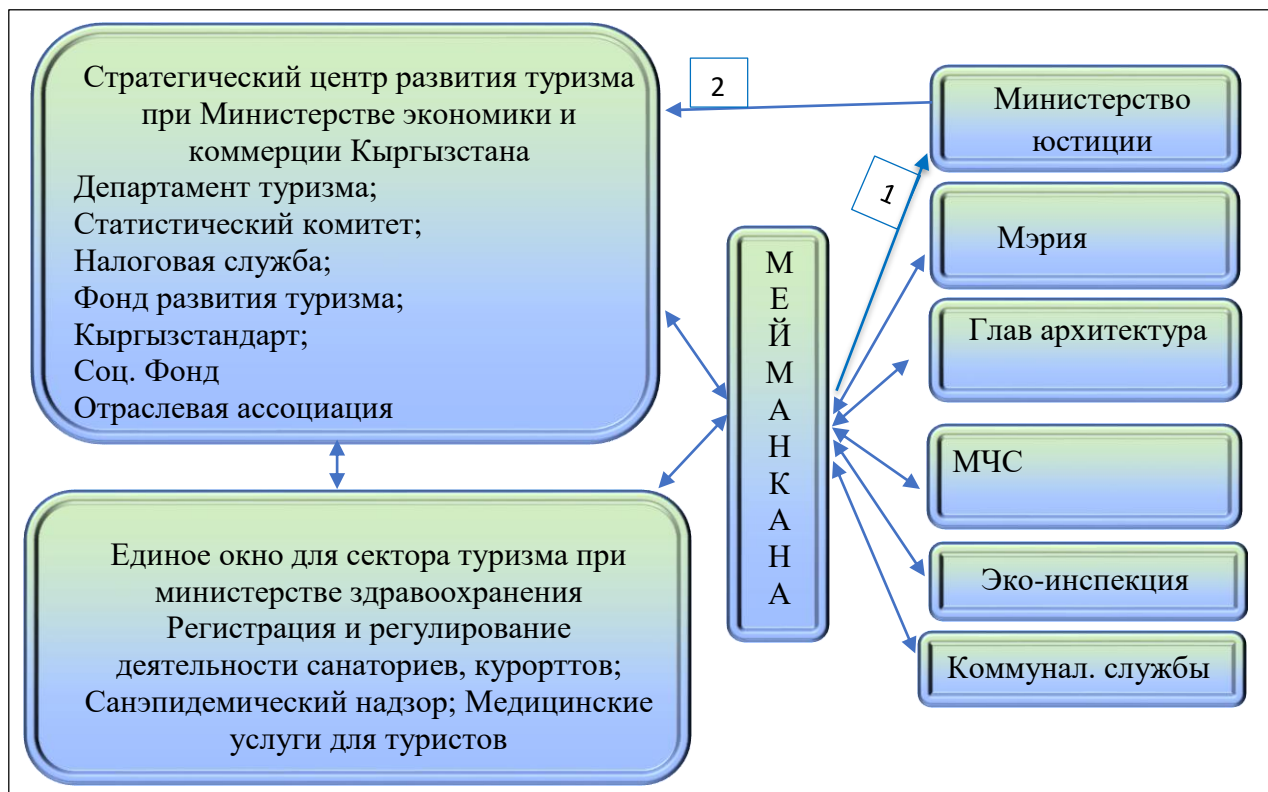
Рисунок 3.3. Модель государственного регулирования гостиниц Бишкека

комитет, налоговую службу и Соцфонд, а затем направляет информационное письмо о новом предприятии в Фонд развития туризма и в санэпидемнадзор. После этих этапов, работы по открытию гостиницы, идут по существующей системе, например, гостиница обращается в Мэрию по рекламным или территориальным вопросам, а в Главархитектуру для внесения изменений в здании. Также необходимо заполнить соответствующую документацию по вопросам пожарной безопасности и коммунального хозяйства. Стоит отметить особую роль отраслевых ассоциаций, так как сильные ассоциации могут обеспечить быстрое решение многих отраслевых проблем и влияют на повышение качества продукции.