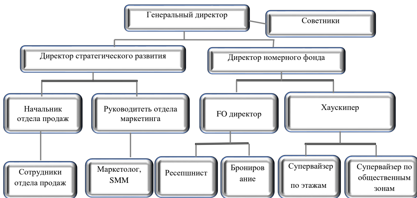
Рисунок 1.1. Линейно – функциональная структура управления гостиницы

Гостиничный бизнес не только играет ведущую роль в экономике туризма, но и имеет решающее значение для формирования психологии туризма с такими аспектами, как удовлетворенность путешествиями, привлекательность и комфорт [Организация и управление гостиничным бизнесом [Текст]: учебник / под ред. А. Л. Лесника, А. В. Чернышева. – М.: Издательский дом “Альпина”, 2001. – 238 с.]. В соответствии с международной практикой управление гостиницами может иметь линейную, функциональную и линейно-функциональную структуру. Организационная схема линейно – функционального управления показана ниже (рисунок 1.1).