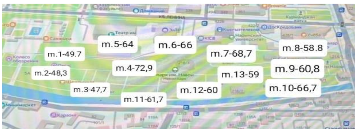
3.3.3.1 – сүрөт. А. Навои паркындагы ызы-чуу деңгээлинин картасы (үндүн эквиваленттүү деңгээли көрсөтүлгөн, дБА)

А. Навои сейил бак Ош шаарынын борбордук районунда, жээк менен Ак буура дарыясынын жанында жайгашкан. Парктын өсүмдүк курамы жалпысынан Т. Сатылганов атындагы паркка окшош, бирок бул жерден каштан жана, теректер сыяктуу дарактардын түрлөрүн кездештирүүгө болот, бадалдардын арасынан сары акация өзгөчөлөнүп турат. Көчөттөр көп тилкелүү түзүлүштө уюштурулган.