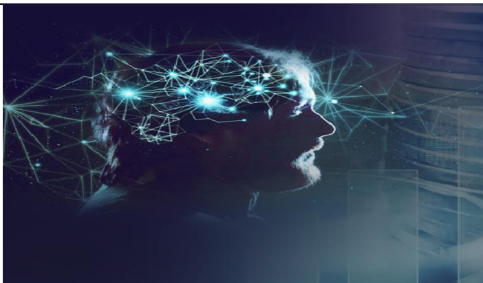
Рис 1.1. За уровень дохода на 99% отвечают уровень нейронного финансового термостата