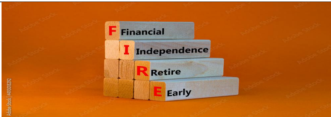
Рис 2.1. FIRE, когда есть финансовая независимость можно рано уходить на пенсию. Концептуальные слова FIRE: финансовая независимость позволяет уходить на пенсию раньше срока .