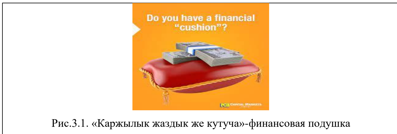
Рис.3.1. «Каржылык жаздык же кутуча»-финансовая подушка