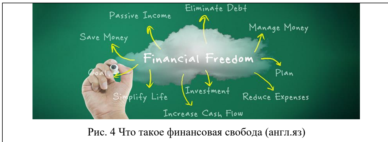
Рис. 4 Что такое финансовая свобода (англ.яз)

чыгымдарыңызды жабуу үчүн жетиштүү ресурстарга ээ болгон мамлекет. Бул сиз айлыкка же үзгүлтүксүз кирешеге көз каранды эмессиз жана өзүңүздүн каржыңызды кантип колдонуу боюнча чечимди эркин кабыл ала аласыз дегенди билдирет» (Тод Кристен). Для большей наглядности обратимся к визуальному представлению финансовой свободы.