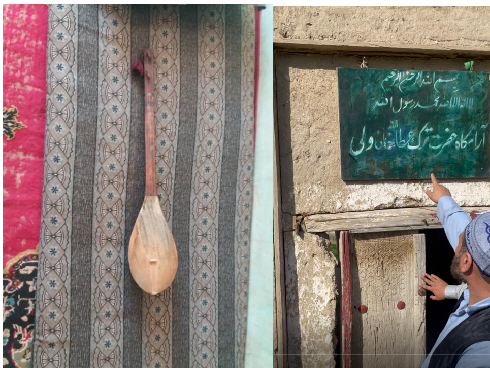
Рисунок 3. Домбра афганских тюрков (Полевые материалы автора. Экспедиция в Государства Афганистан, Провинция Тахар. г. Саманган. Февраль 2024 г.)