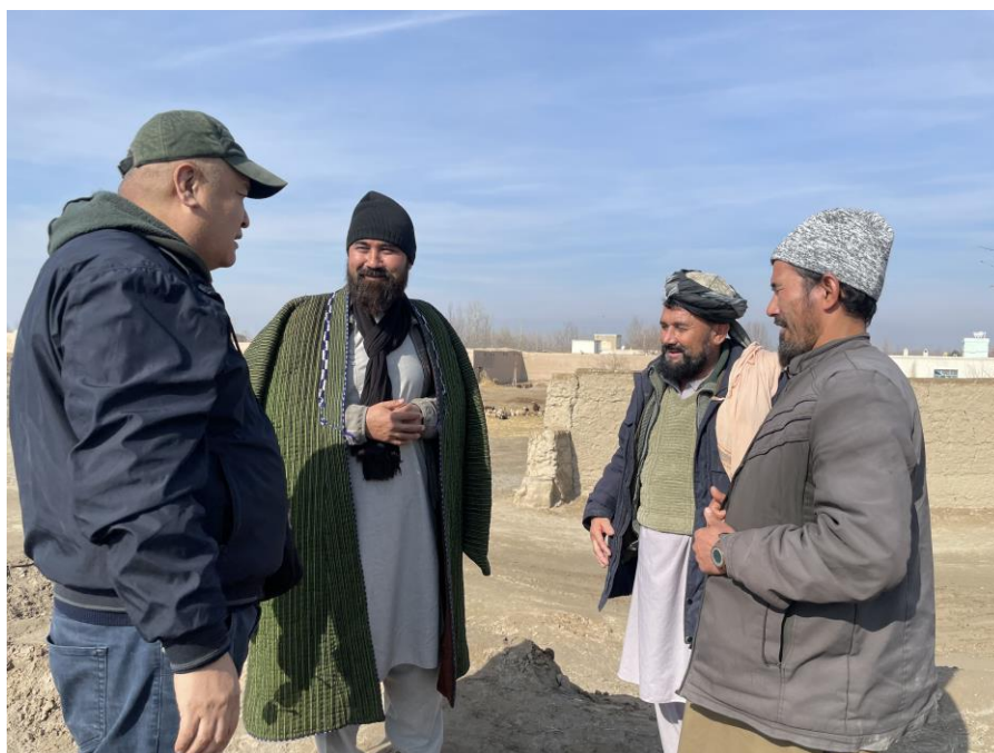
Рисунок 1. Афганские тюрки ( Полевые материалы автора. Экспедиция в Государства Афганистан, Провинция Тахар. Г. Мазари-Шариф. Ноябрь 2023 г. ).