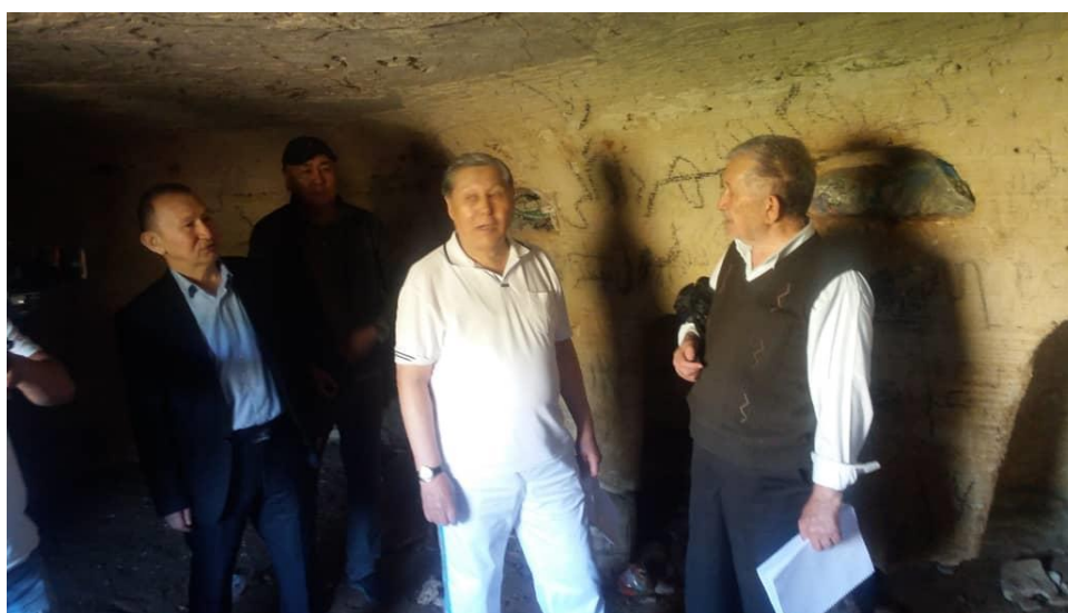
1. Рисунок 5. Мазар Шахрубат ата (Полевые материалы автора. Экспедиция в Исламскую Республику Иран, Провинция Гулестан. г. Бендер-Туркмен. Август 2018 г.)