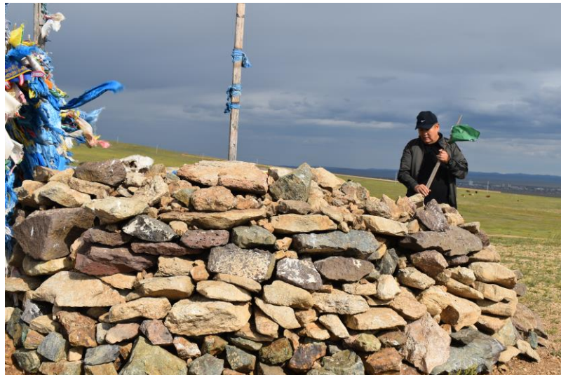
Рисунок 7. Оба (Полевые материалы автора. Экспедиция в Монголия, Провинция Хэнтей. Октябрь 2023 г.)