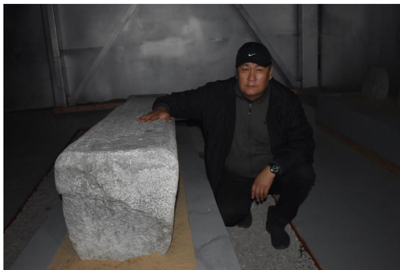
Рисунок 8. Надпись Тонькок (Полевые материалы автора. Экспедиция в Монголию, Октябрь 2023 г.)