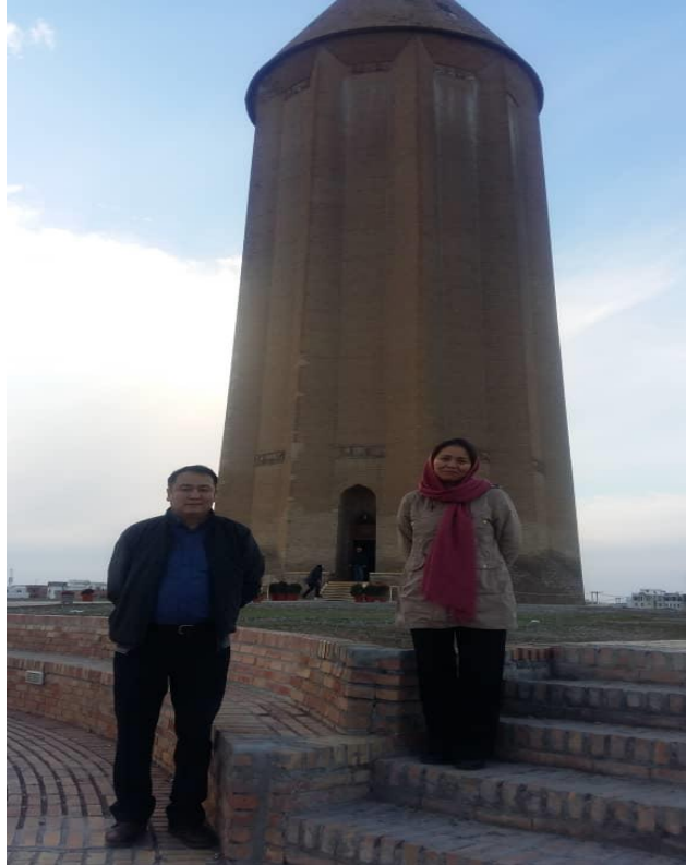
Рисунок 6. Кумбаде Кабус (Полевые материалы автора. Экспедиция в Исламскую Республику Иран, Провинция Гулестан. г. Кумбад. Октябрь 2019 г.)