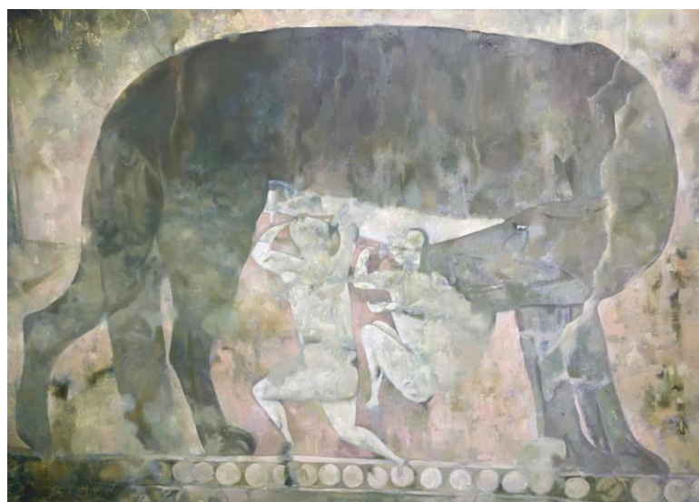
Рисунок 9. Копия настенной росписи. Волчица кормящий двух младенцев (Полевые материалы автора. Экспедиция в Республику Таджикистан, Ноябрь 2024 г. VI-IX вв. Бунджикат, Таджикистан)