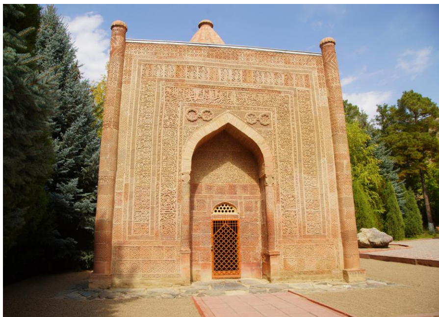
Рисунок 10. Мазар Манас-Ордо (с. Ташарык, Таласской области, Кыргызская Республика).