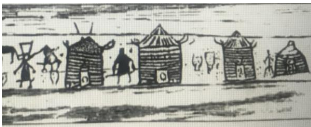
Рисунок 11. Петроглифы Боярского хребта (II–I вв. д.н.э.) (Кызласов Л.Р. Очерки по истории Сибири и Центральной Азии. –Красноярск, Изд-во Краснояр. Университета, 1992 г. -224 стр.)