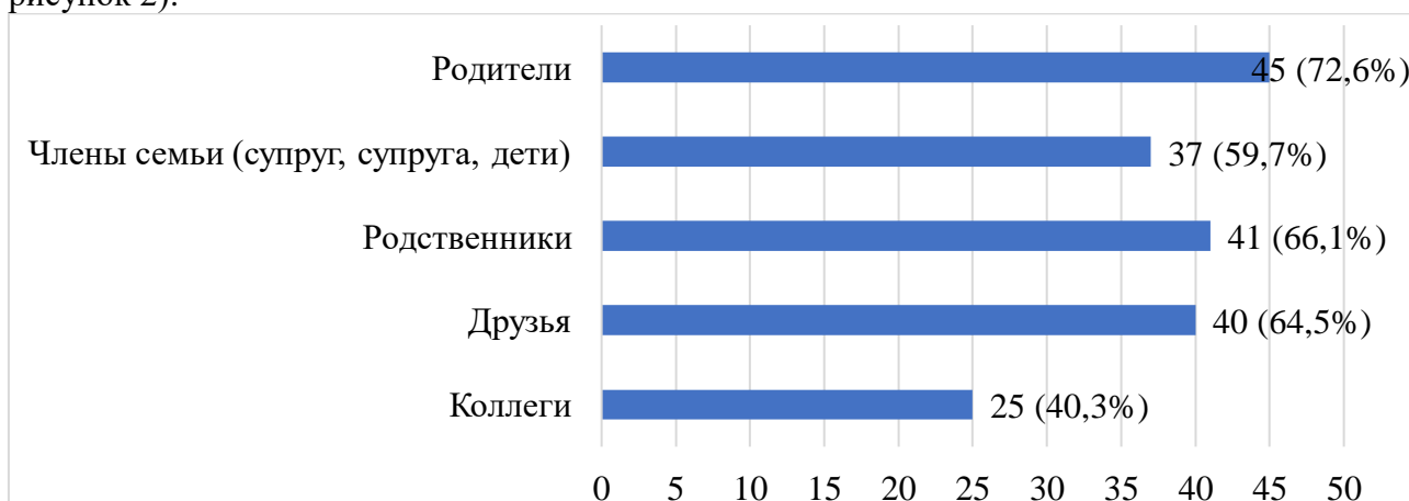
Рисунок 2. Распределение клиентов пробации по поддерживаемым социальным связям

Клиенты пробации, которые участвовали в исследовании, поддерживают связь с родителями, членами семьи (супруг, супруга, дети), родственниками, друзьями и коллегами. 45 клиентов или 72,6% клиентов отметили, что поддерживают связь с родственниками, 37 клиентов (59,7%) поддерживают связь с членами семьи, 41 клиент (66,1%) с родственниками, 40 клиентов (64,5%) с друзьями и 25 клиентов (40,3%) поддерживают связь с коллегами (см. рисунок 2).