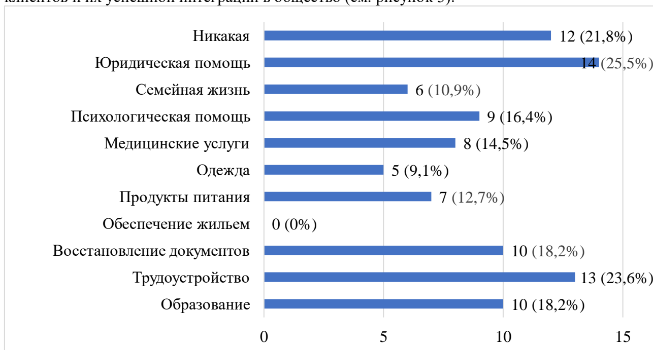
Рисунок 3. Сферы жизни клиентов, в которых пробация оказала помощь

оказывает многостороннюю поддержку, включая юридическую помощь, трудоустройство, психологическую помощь и восстановление документов, что способствует реабилитации клиентов и их успешной интеграции в общество (см. рисунок 3).