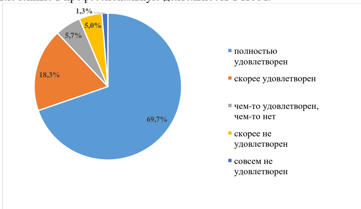
Рисунок 3.2. Оценка удовлетворённости преподавателей и сотрудников своей работой вузе, %

На диаграмме 3.2 показаны сопоставительные итоги анкетных опросов, в ходе которых приняли участие 113 преподавателей и сотрудников, вовлеченные в профессиональную деятельность в ИЭМ.