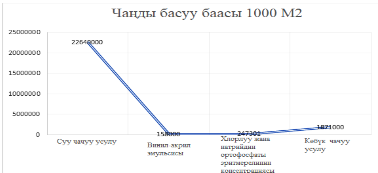
4.1-сүрөт – Чандан тазалоо ыкмаларынын салыштырмалуу натыйжалуулугу*

Кыргызстандын түштүк аймагынын географиялык шарттарын жана климаттык өзгөчөлүктөрүн эске алуу менен автор чандан тазалоонун винил-акрил ыкмасын сунуш кылат (4.1-сүрөт).