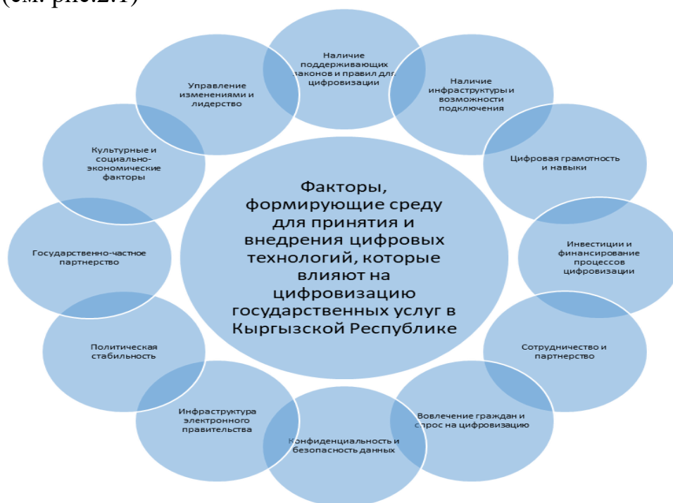
Рисунок 2.1. Факторы, которые формируют окружение для организации и внедрения цифровых технологий

Анализируя различные международные примеры, важно отметить, что на процесс цифровизации государственных услуг в Кыргызстане воздействует множество факторов, создающих условия для принятия и реализации цифровых технологий. Можно эти факторы разделить на несколько основных направлений (см. рис.2.1)