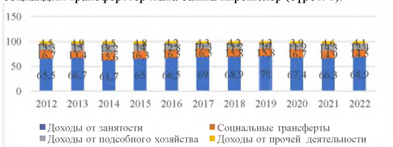
Сүрөт 1. - КР үй чарбаларынын акчалай кирешелеринин түзүмү (калктын жан башына орточо алганда, жыйынтыкка карата %).

КРсынын ИДПсынын өсүшүнүн негизги фактору болуп саналган калктын акчалай кирешелерине комплекстүү талдоо жүргүзүүнүн натыйжалары көрсөтүлдү, анткени калктын акчалай кирешеси аркылуу төлөөгө жөндөмдүү суроо-талапты түзгөн жеке керектөө продукция өндүрүүнү пайда кылууда. КР калкынын акчалай кирешелери ирилештирилген төрт топтон турат: бул эмгек акы (иш менен камсыз кылуудан кирешелер), көмөкчү чарбадан кирешелер, социалдык трансферттер жана башка кирешелер (сүрөт. 1).