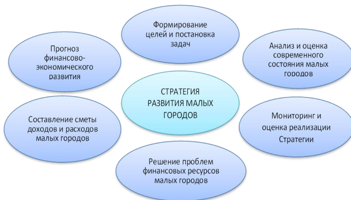
Рисунок 3.1. Стратегические основы развития малых городов

В диссертационной работе нами предложена Стратегия финансового развития малых городов Чуйской области, где Стратегия финансового развития малых городов подразумевает алгоритм действий по моделированию стратегического плана с учетом определения целей и задач, разработкой новых критериев управления финансовыми ресурсами, аналитической оценки текущего финансового состояния малых городов, составление сметы доходов и расходов городских муниципальных образований, решение проблем поиска дополнительных финансовых ресурсов для малых городов, составление прогнозов финансового состояния и мониторинг реализации стратегии развития малых городов.