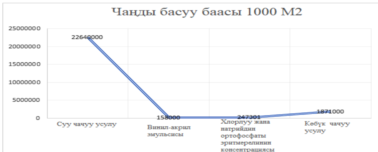
4.1-сүрөт – Чандан тазалоо ыкмаларынын салыштырмалуу натыйжалуулугу*

Кыргызстандын түштүк аймагынын географиялык шарттарын жана климаттык өзгөчөлүктөрүн эске алуу менен автор чандан тазалоонун винил-акрил ыкмасын сунуш кылат (4.1-сүрөт).