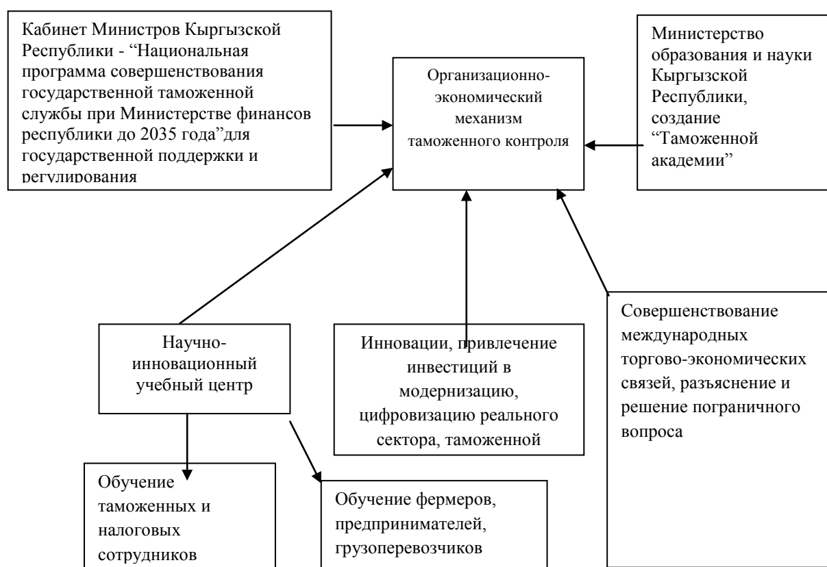
Рисунок 3.2 - Модель совершенствования организационно-экономического механизма государственного таможенного контроля в Кыргызской Республике

Совершенствование организационно-экономического механизма государственного таможенного контроля осуществляется "Национальной программой совершенствования государственной таможенной службы при Министерстве финансов Кыргызской Республики на 2025-2035 годы", направленной на существенное повышение роли внешнеторговых связей и цифровизацию инфраструктуры таможенной службы, являющейся основой увеличения платежей налоговых доходов (рис.3.2).