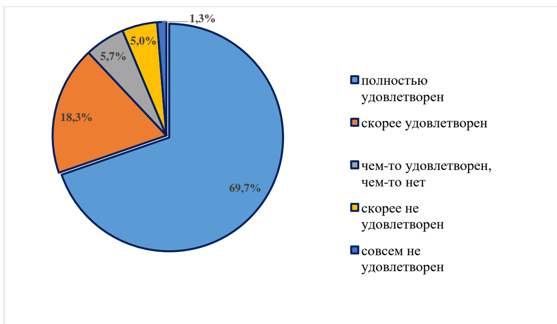
Рисунок 3.2. Оценка удовлетворённости преподавателей и сотрудников своей работой вузе, %

Таким образом, распределение ответов свидетельствует о высоком уровне удовлетворенности преподавателей и сотрудников своей профессиональной деятельностью в вузе, что отражает преобладание позитивного отношения к работе основной части профессорско-преподавательского состава.