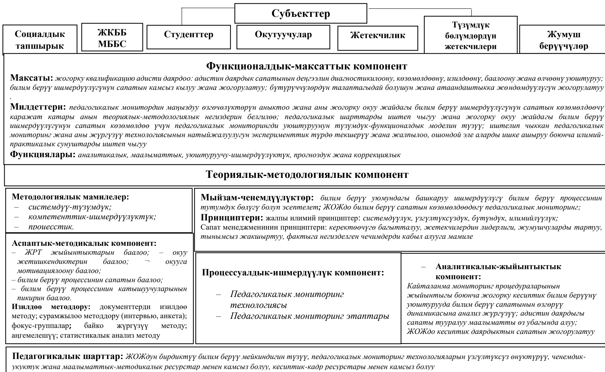
Сүрөт 2.1. Педагогикалык мониторингдин түзүмдүк-функционалдык модели