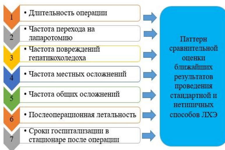
Рисунок 5.1.1 Паттерн сравнительной оценки ближайших результатов проведения стандартной и нетиповых способов лапароскопической холецистэктомии

Оценка непосредственных результатов у этих пациентов была проведена по определенному паттерну, который представлен на рисунке 5.1.1.